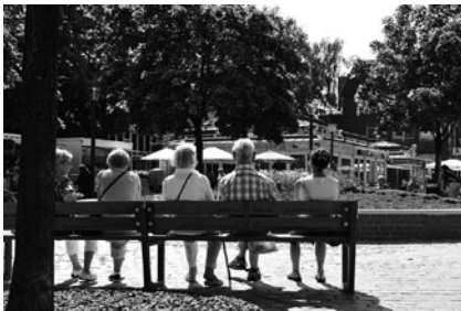
Kurze Rast vom Bummeln

Ende Juni 2010 konnte die Tibarg Arbeitsgemeinschaft ihren Antrag zur Einrichtung eines BID (Business Improvement Districts) im Bezirksamt einreichen. Idee dahin-