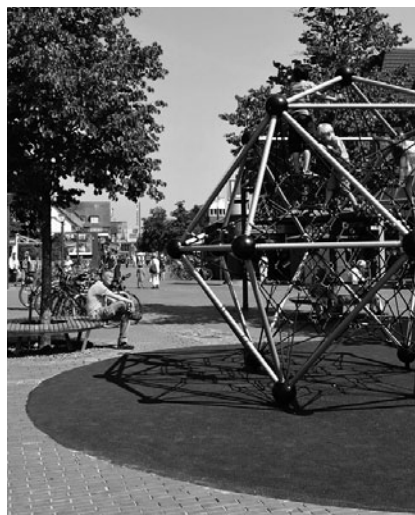
Neue Spielgeräte am Tibarg-Süd

Wo welches Geschäft liegt und was im Stadtteil los ist, darüber informieren die neuen Lagepläne und Infotafeln. Sie helfen bei der Orientierung und bieten den Vereinen vor Ort die Möglichkeit ein bisschen Werbung in eigener Sache zu machen.