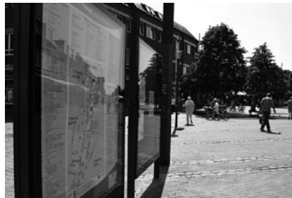
Beste Orientierung dank Infotafeln

Agenda. Die neuen Aktionsflächen laden Kinder zum kurzen Wippen und Spielen ein, während die Erwachsenen ihnen auf den neuen Sitzmöglichkeiten dabei zusehen und sich über den neusten niendorfer Schnack unterhalten können. Für die Kinder ist wohl das neue Klettergerüst am südlichen Ende der Meile am Spannsten. Hier kann geklettert werden, bis Mama oder Papa weiter einkaufen wollen.