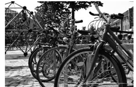
Rad anschließen und shoppen

Am auffälligsten dürfte aber der neu gestaltete Dorfplatz sein. Das Blumenrondel wird je nach Jahreszeit neu bepflanzt und lädt zur kurzen Pause und zum Verschnaufen ein. Schließlich wurde rund