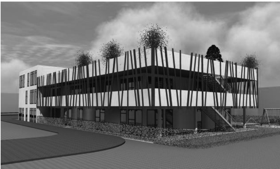
Modern wird die Kita, wenn sie fertig ist.

Finanziert werden die 2,6 Millionen Euro für das dreistöckige Gebäude vom Verein Grün-Weiß Eimsbüttel und der Behörde für Arbeit, Soziales, Familie und Integration. Für den Verein ist das