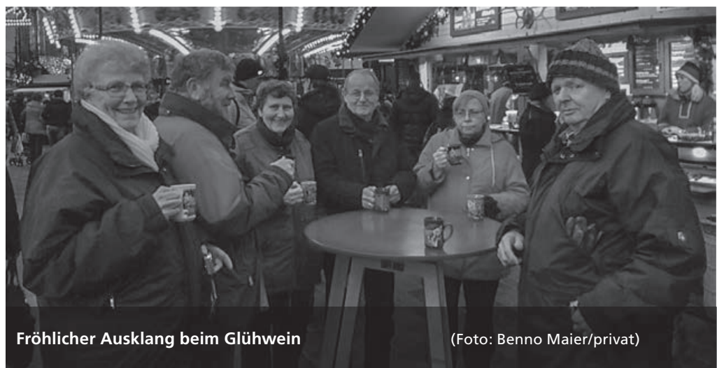
Fröhlicher Ausklang beim Glühwein