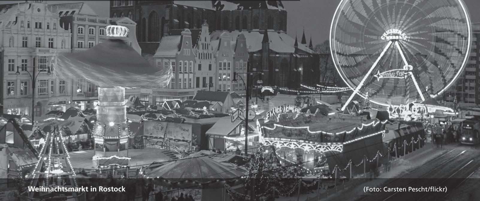
Weihnachtsmarkt in Rostock