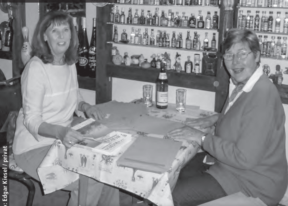
Fleissige Helfer machen die Exemplare für unsere Mitglieder versandfertig