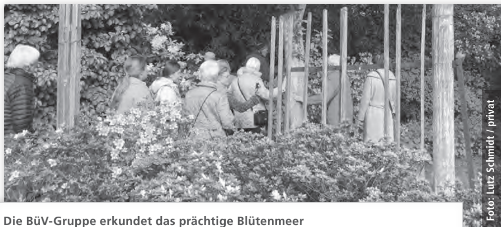
Die BüV-Gruppe erkundet das prächtige Blütenmeer