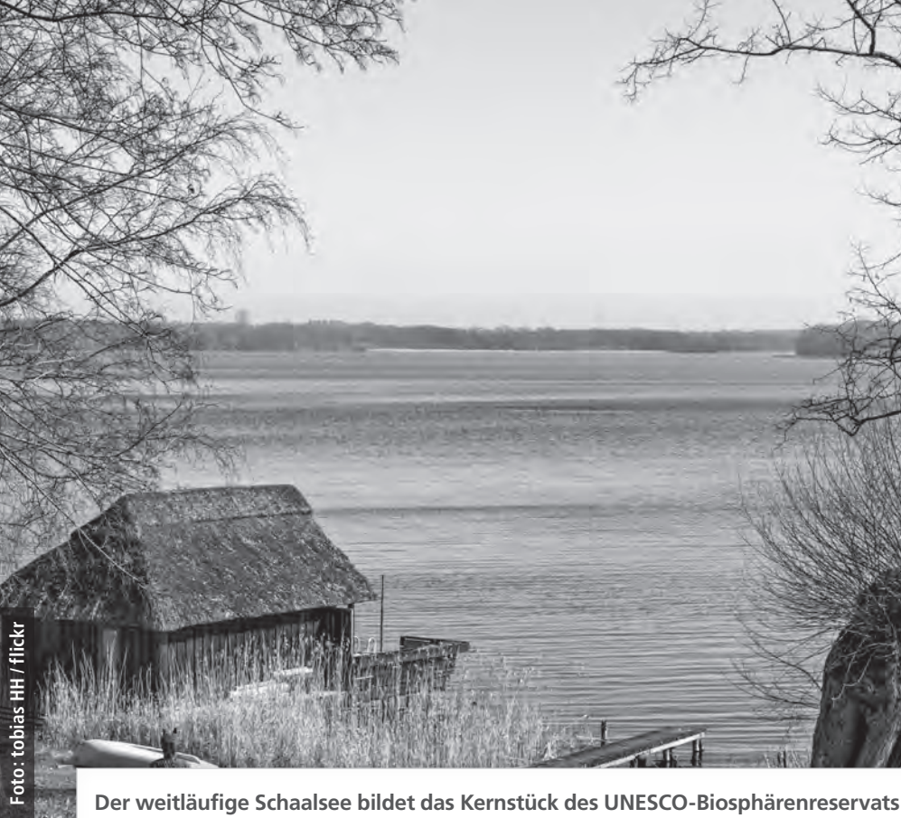
Der weitläufige Schaalsee bildet das Kernstück des UNESCO-Biosphärenreservats