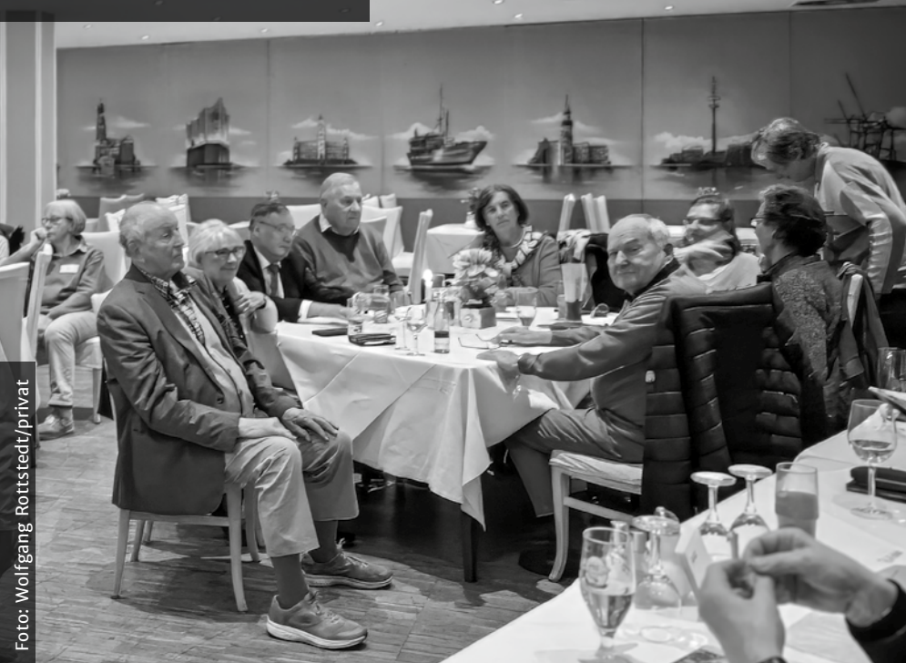
Die Zahl der Teilnehmenden blieb leider recht übersichtlich