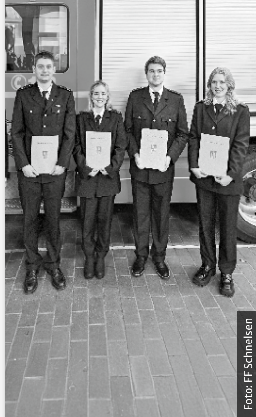
Die frisch Beförderten